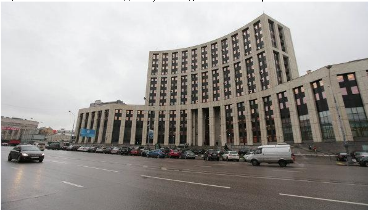
Здание Внешэкономбанка РФ

Евразийский экономический союз - международная организация региональной экономической интеграции, в нее входят Армения, Белоруссия, Казахстан, Киргизия и Россия. ЕАЭС создан в целях всесторонней модернизации, кооперации и повышения конкурентоспособности национальных экономик и создания условий для стабильного развития.