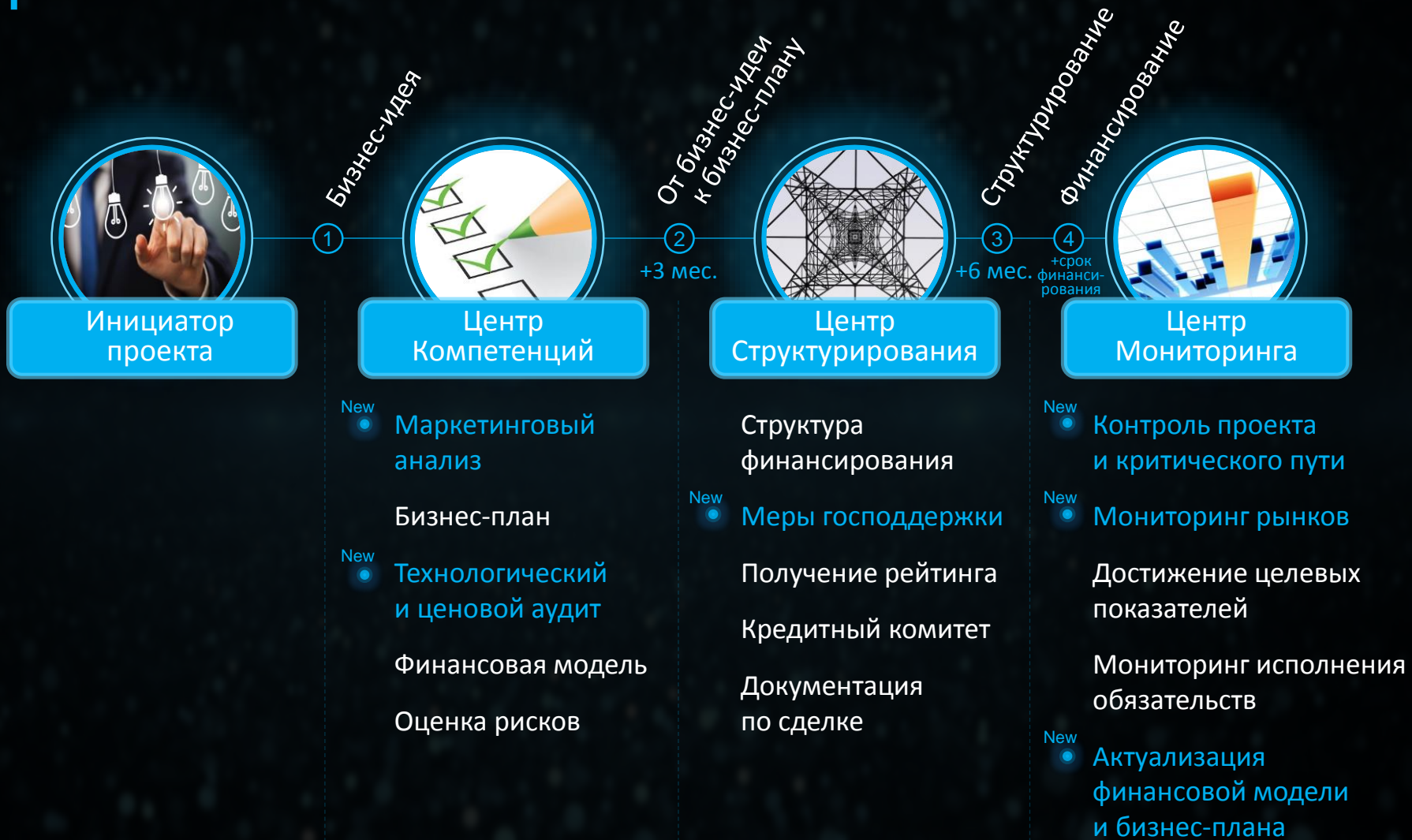
Схема работы «фабрики» проектов ВЭБ 2.0