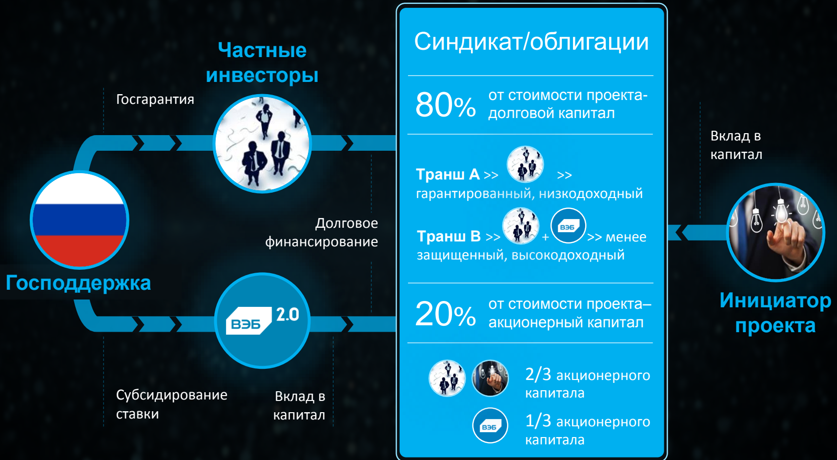
Схема финансирования проектов ВЭБ 2.0